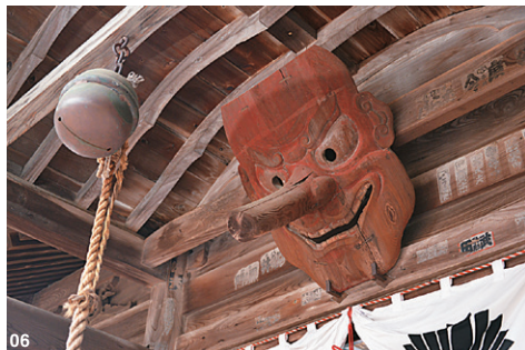
01&02以萩市為主題的萩博物館，展出長州藩至幕末維新的歷史。03萩城下町舊町人地的菊屋橫丁，優美景致被列為日本街道百選。04幕末尊王攘夷運動的領袖人物高杉晉作的誕生地05伊藤博文與高杉晉作幼年寄讀的円政寺06円政寺內飾於金毘羅社門楣的赤天狗面具，背面雕飾除魔的唐獅子牡丹紋。