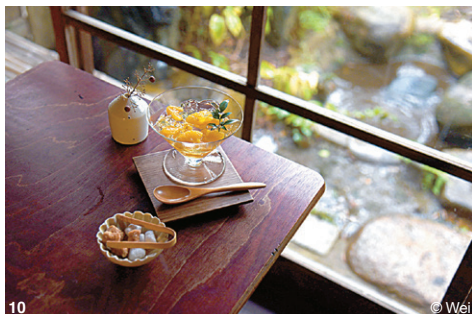
07寺內石燈籠有日本第一石燈籠之稱，雕飾飛龍為市指定文化財。08展示萩市傳統萩燒工藝之作的彩陶庵09&10位於萩城下町的古民家咖啡廳「コトコト（晦事）」，品嚐萩燒杯具盛裝的手沖咖啡和地產夏蜜柑果凍。