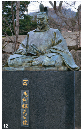
07&08日本初代總理大臣伊藤博文的舊宅及移築自東京的別邸09長州藩（萩藩）的城閣於明治初期拆毀以示尊王決心，目前只餘城跡。10萩市隨處可見在地名產夏蜜柑11萩城下町保存最完好的武家宅邸「口羽家住宅」，外牆飾以烏瓦砌成的海參壁。12創建萩城的毛利輝元公

舊上級武家地的建築群中，表門規模最大且唯一保存有主屋的「口羽家住宅」，被指定為國家重要文化財。口羽家為毛利氏旁系，隨著毛利輝元公一同退守萩城，後代子孫至今仍居住於此，並將一部份建築及庭院開放給大眾參觀。